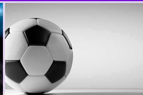
Juegos de fútbol de la escuela secundaria

Torneo 5 y 6 de marzo 5:00 p. m. y 7:00 p. m. @ECRA