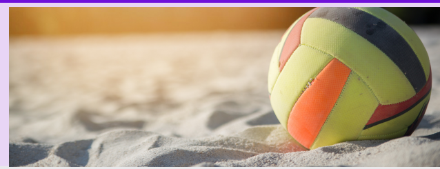
Juegos de voleibol de escuela secundaria

4 de marzo - 4 p.m. @ ECRA 15 de marzo a las 5 p.m. @ Christine Duncan 15 de marzo - 6 p.m. @ Christine Duncan 20 de marzo a las 5 p.m. en ECRA 20 de marzo a las 6 p.m. @ ECRA 21 de marzo - 4:30 p.m. @ ECRA