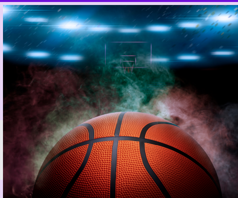
Juegos de baloncesto de la escuela secundaria

4 de marzo - 4 p.m. @ ECRA 15 de marzo a las 5 p.m. @ Christine Duncan 15 de marzo - 6 p.m. @ Christine Duncan 20 de marzo a las 5 p.m. en ECRA 20 de marzo a las 6 p.m. @ ECRA 21 de marzo - 4:30 p.m. @ ECRA